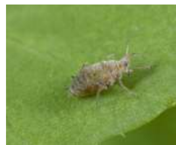
شکل ۱- کلنی شته مومی روی برگ و گل کلزا و حشره کامل شته مومی