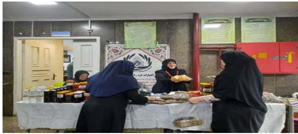
برپایی نمایشگاه توانمندی های زنان روستایی و عشایر استان تهران؛ به مناسبت شب پلدا