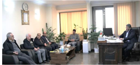
دیدار کارشناسان ارزیابی و عملکرد معاونت آب و خاک وزارت جهاد کشاورزی با رئیس سازمان جهاد کشاورزی استان تهران