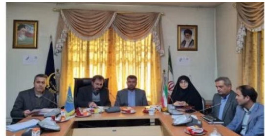
بررسی راهکارهای فعال کردن واحدهای تولیدی کشاورزی و دامپروری در ستاد تسهیل و رفع موانع تولید فیروزکوه