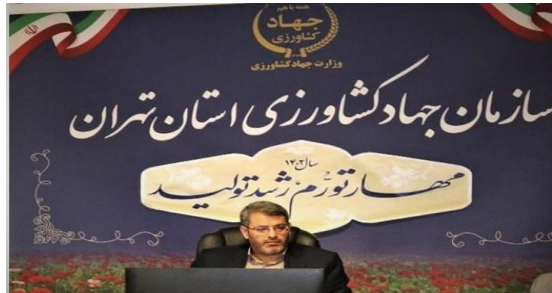
۵۳ هزار قطعه از اراضی کشاورزی استان تهران سند دار شد