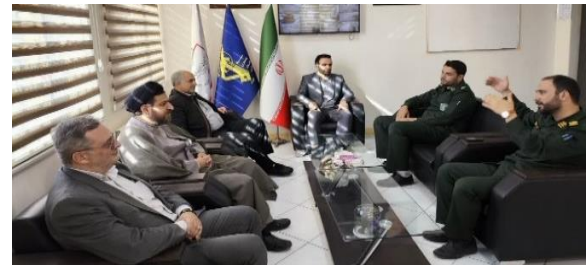
دیدار سرپرست جهاد کشاورزی فیروزکوه با فرمانده سپاه شهرستان به مناسبت اعیاد شعبانیه و روز پاسدار