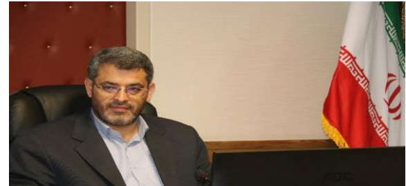
همزمان با قرارگاه ملی امنیت غذایی عنوان شد: استان تهران بالاترین عملکرد جوجه ریزی ماهانه را رقم زد