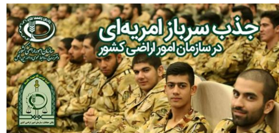
فراخوان پنجمین مرحله جذب سربازان امریه ای در سازمان امور اراضی کشور