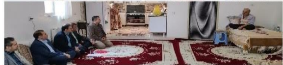
تجلیل مسئولین شهرستان قرچک از خانواده معزز شهدا و اینثارگران جهادگر