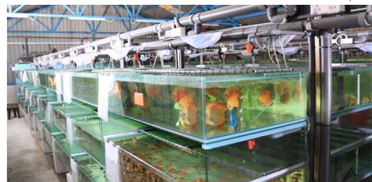
تولید سالانه ۴۶ میلیون قطعه ماهی زینتی در استان تهران