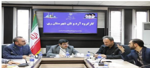
بررسی مسائل و مشکلات موجود در حوزه واحدهای صنفی نانوایی شهرستان ری