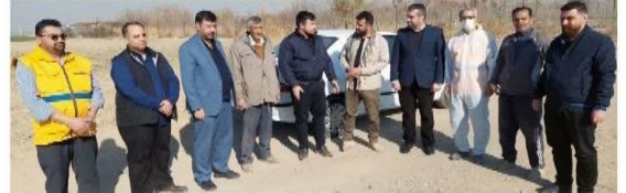
برپایی رزمایش گروه جهادی در حوزه های ضد عفونی و واکسیناسیون رایگان دام، توزیع نهال ودوره آموزشی ترویجی با هدف محرومیت زدایی