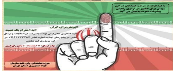
اجرای پویش برای ایران به احترام یک شهید؛ همزمان با انتخابات