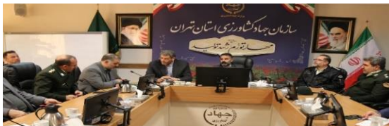
برگزاری دوره آموزشی ضابطین قضایی امور اراضی استان