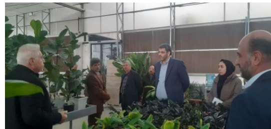
بازدید اعضای کمیسیون تبصره یک ماده یک استان از طرح های شهرستان شهریار و اسلامشهر