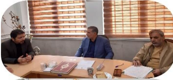
تامین آب مورد نیاز مزارع کشاورزی از طریق تخصیص پساب تصفیه خانه فیروز بهرام با حفظ سهمیه آب بخش کشاورزی