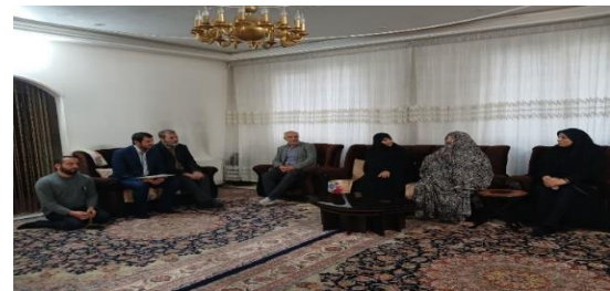
دیدار با مادران و همسران شهدای سنگرز بی سنگر به مناسبت وفات حضرت ام البنین (س) همراه با همکاران مرکز مقاومت بسیج وزارت