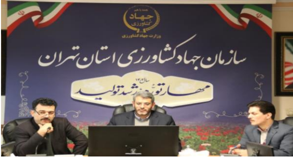
مدیر کل دفتر امور غلات و محصولات اساسی وزارت جهاد کشاورزی: فعالیت های نوآورانه کشاورزان استان تهران از جمله اصلاح الگوی کشت تولید علوفه و ارتقای بهره وری آب، نمونه بسیار خوبی برای کشور است