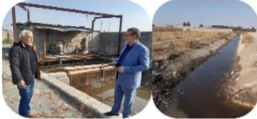
تخصیص پساب تصفیه خانه صالح آباد به به باغداران روستاهای رباط کریم