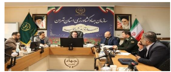
نشست مدیران روابط عمومی ادارات و نهادهای استان تهران به میزبانی سازمان جهاد کشاورزی استان تهران برگزار شد