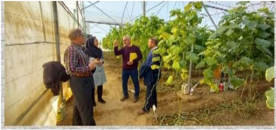
برپایی دوره آموزشی مهارتی مبارزه با آفات و انواع بیماری های گل و گیاه، سبزی و صیفی ویژه گلخانه داران قرچک