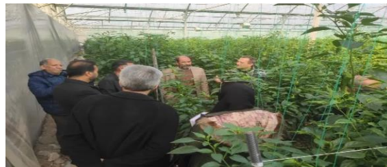
اجرای سایت الگویی و انتقال یافته در گلخانه سبزی و صیفی شهرستان ری