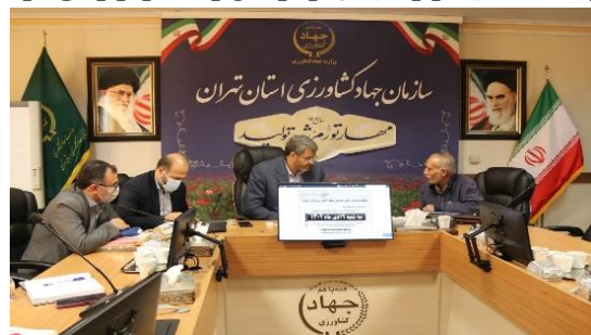
ملاقات بی واسطه مراجعه کنندگان با رییس سازمان