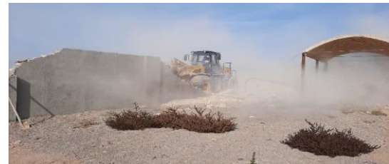
۱۲۰هزارمتر از ساخت وسازهای غیرمجاز در اراضی کشاورزی بخش جوادآباد طی دو روز متوالی آزادسازی شد