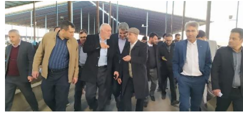
بررسی مشکل آب واحد دامداری گاوشیری شهرستان ورامین با حضور استاندار تهران در قالب دوشنبه های تولید