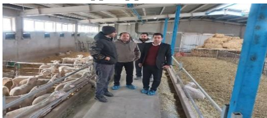
اجرای پروژه همزمان سازی فعلی در دام سبک در سطح کله های شهرستان های استان تهران به منظور مدیریت تولید مثل