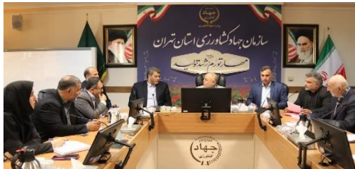
بررسی مسائل و مشکلات بخش کشاورزی شهرستان فیروزکوه با حضور نماینده مجلس شورای اسلامی