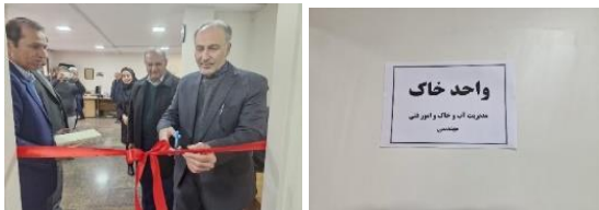
با حضور معاون توسعه مدیریت و منابع سازمان؛ واحد خاک در مدیریت آب و خاک و امور فنی مهندسی استان تهران افتتاح شد