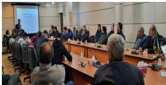
برگزاری دوره آموزشی پرورش دام سنگین با حضور استاد موسسه تحقیقات علوم دامی کشور