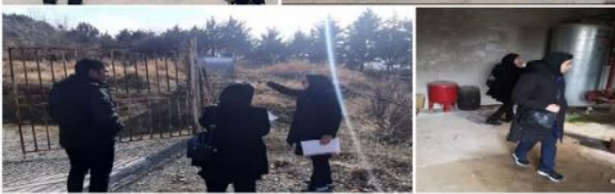
بررسی مشکلات تامین سوخت واحدهای تولیدی شمیرانات در بازدید مشترک کارشناسان شرکت پخش و بالایش، جهاد و صمت