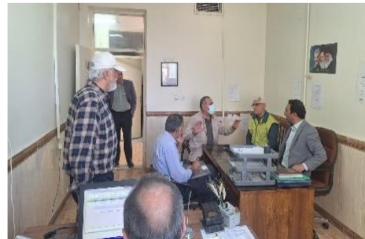
اجرای طرح های تحقیقی - ترویجی و ایجاد کانون های جوانان روستایی

۵- اجرای صد دقیقه برنامه رادیویی با موضوعات تولیدات گیاهی، امور اراضی، دام طیور و آب و خاک ۶- تهیه محصول رسانه نوشتاری - پوستر ترویجی با موضوع جشنواره انار و گل و گیاه باگدشت، گل و کلم کهریزک