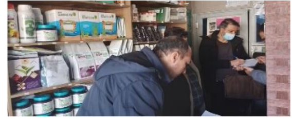
بازدید گشت مشترک از مراکز عرضه کود شیمیایی و سموم در منطقه آیسرد نظارت و کنترل بر روند توزیع سموم کشاورزی در شهرستان دماوند