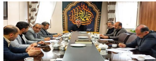
جذب و توزیع یکهزار و ۴۵۲ تن اقلام اساسی در شهرستان ملارد