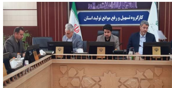
بررسی طرح های تولیدی در کارگروه تسهیل و رفع موانع تولید استان