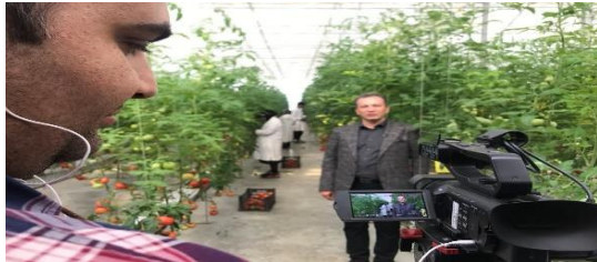
عوامل موفقیت مجموعه گلخانه ای نمونه ملی استان تهران به نمایش درمی آید