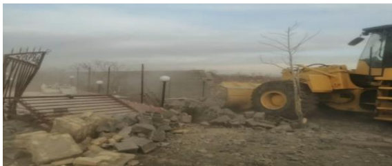
قلع و قمع ۵۰ مورد از ساخت وساز های غیرمجاز در پاکدشت