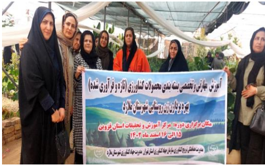
آموزش تخصصی بسته بندی محصولات کشاورزی تازه و فرآوری شده ویژه زنان روستایی شهرستان ملارد