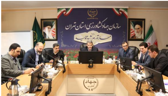
بررسی اقدامات در خصوص تحقق شعار سال و پیگیری مطالبات مقام معظم رهبری (مدظله العالی) در کمیته مدیریت عملکرد سازمان