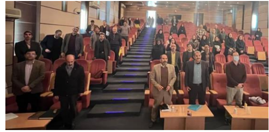
برپایی دوره آموزش و انتقال یافته ها با محوریت تغذیه گیاهی و کنترل، مبارزه با عوامل خسارتزا در استان تهران