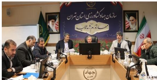
بررسی و تعیین تکلیف پرونده های کمیسیون تبصره یک ماده یک امور اراضی استان تهران با تاکید بر تقویت گردشگری کشاورزی