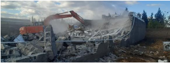
روبای سازندگان ساخت و ساز غیر مجاز در اسلامشهر نقش بر آب شد