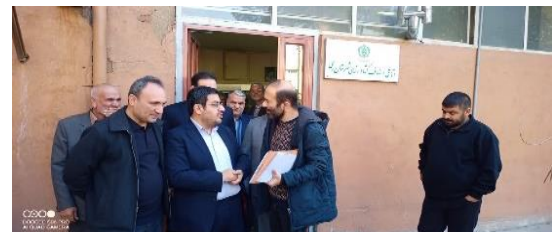
بازدید سرزده معاون استاندار و فرماندار ویژه شهرستان ری از مجموعه مدیریت جهاد کشاورزی شهرستان