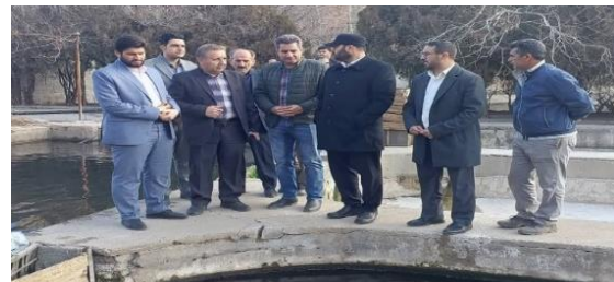
بازدید فرماندار و دادستان پردیس از مجتمع پرورش ماهی قزل آلا؛ با هدف تقویت تولید و رفع موانع