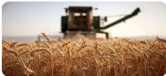
سطح کشاورزی قراردادی استان تهران به بیش از ۲۲ هزار هکتار رسید