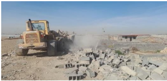
آزادسازی ۱۴ هزار متر مربع در پی تخریب دیوارکشی های پیشوا