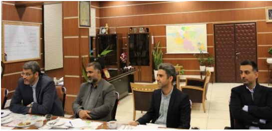
تعیین میزان کل اراضی کشاورزی استان تهران در جلسه مشترک اداره کل ثبت اسناد و جهاد کشاورزی استان