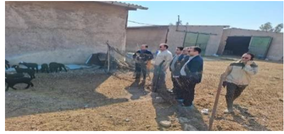
بازدید نماینده دیوان محاسبات به همراه معاون بهبود تولیدات دامی و سایر مسئولان از ایستگاه اصلاح نژاد قوچ زندی