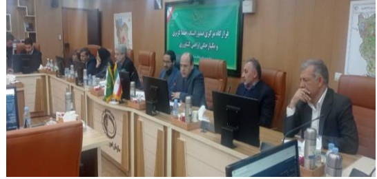
بنابر اعلام سازمان امور اراضی کشور در فرارگاه صدور اسناد کشاورزی: استان تهران با ۵۵ درصد کاداستر اراضی، معادل ۱۰۵ هزار هکتار رتبه نخست کشور را کسب کرد