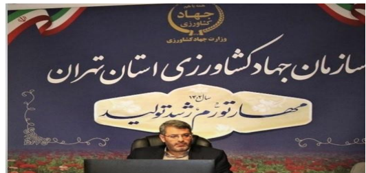
عرضه بالغ بر ۵هزار تن میوه و خرما در استان تهران / مردم از بابت میوه شب عید نگرانی نداشته باشند