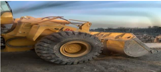
قلع و قمع ۱۰۰ مورد از ساخت و ساز های غیر مجاز در شهرستان باگذشت