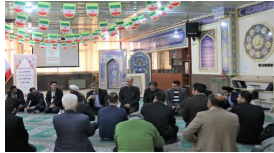
نشست صمیمانه همکاران و مسئولان سازمان جهاد کشاورزی استان