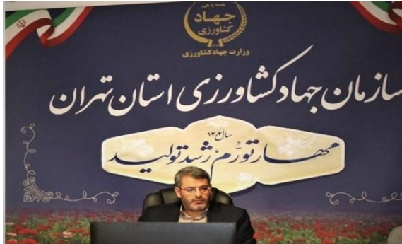
بیمه محصولات زراعی پاییزه با ۶۱ درصد رشد نسبت به مدت مشابه به ۲۴ هزار هکتار رسید