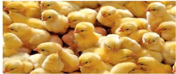
استان تهران با ۹۶۰ هزار قطعه جوجه ریزی، رتبه اول جوجه ریزی کشور را به خود اختصاص داد