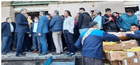
بازدید میدانی روند عرضه گوشت و مرغ در میدان بهمن