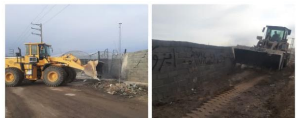
آزاد سازی ۹ هکتار از اراضی کشاورزی شهرستان رباط کریم