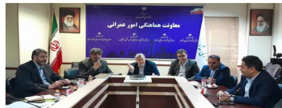
برگزاری جلسه کارگروه مدیریت پسماند با حضور معاون هماهنگی امور عمرانی استانداری