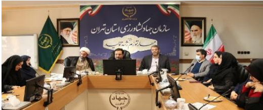
نشست صمیمی ویژه بانوان به مناسبت ولادت حضرت زهرا