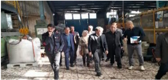
بازدید مدیران و کارشناسان فنی وزارت کشاورزی عراق از پروژه های آب و خاک استان تهران و کارخانجات لوله سازی