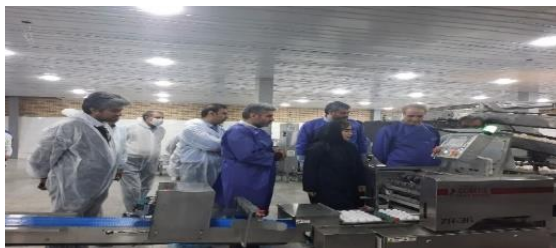
افتتاح طرح توسعه زنجیره تخم مرغ استان تهران با حضور معاون وزیر که با این بهره برداری، تولید مرغ تخم گذار این واحد به ۷۰۰ هزار قطعه رسید