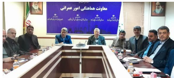
احیای تالاب بند علیخان می تواند از فرونشست دشت ورامین جلوگیری کند