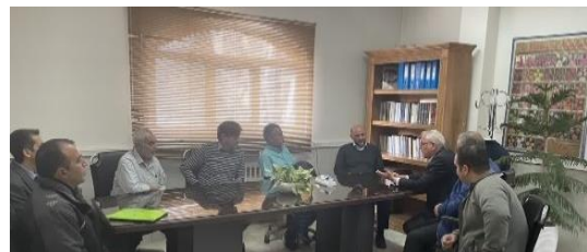
هم اندیشی و بررسی مسائل و مشکلات اتاق اصناف کشاورزی اسلامشهر