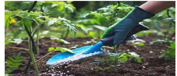
توزیع ۲۶ هزار تن کودشیمیایی یارانه ای بین کشاورزان استان تهران