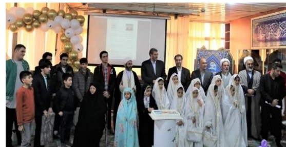
برپایی جشن عبادت و بندگی فرزندان همکاران سازمان