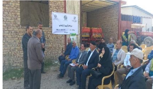
دوره آموزشی توسعه کشت کلزا ورامین

۵- اجرای صد دقیقه برنامه رادیویی با موضوعات تولیدات گیاهی، امور اراضی، دام طیور و آب و خاک ۶- تهیه محصول رسانه نوشتاری - پوستر ترویجی با موضوع جشنواره انار و گل و گیاه باگدشت، گل و کلم کهریزک