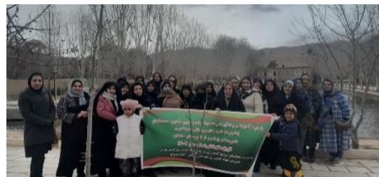
آموزش تخصصی گردشگری ویژه تسهیلگران زن روستایی و عشایری شهرستان ورامین

۷- اجرای پروژه نهضت مهندسی پیام با ارسال ۱۱۱ بسته پیامک