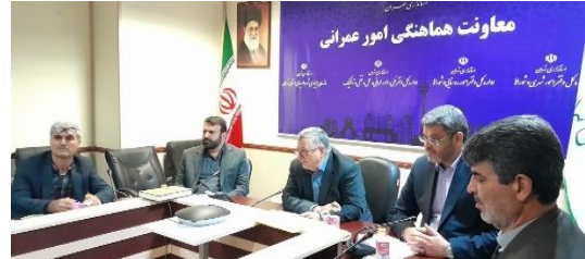
تعیین تکلیف ۴۶ پرونده در کمیسیون تبصره یک ماده یک امور اراضی استان