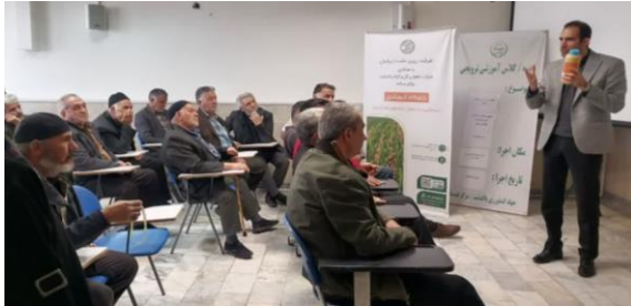
آشنایی کشاورزان پاکدشتی با جدیدترین روشهای کنترل و مبارزه با علف های هرز مزارع