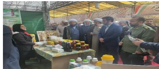
برپایی نمایشگاه توانمندی زنان روستایی در اسلامشهر