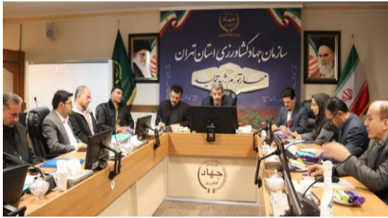
برپایی جلسه اصلاح الگوی کشت تولید علوفه و ارتقا بهره وری آب و خاک جهت تشریح برنامه های الگوی کشت محصولات علوفه ای با حضور مدیر کل دفتر امور غلات و محصولات اساسی