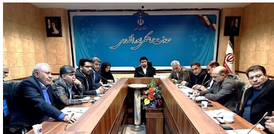
برگزاری ششمین جلسه تنظیم بازار محصولات اساسی کشاورزی استان تهران