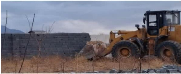
قلع و قمع ۸۰ افقره ساخت و ساز غیر مجاز در اراضی کشاورزی دماوند