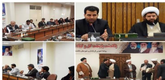
تعیین رابطین بخش کشاورزی در شورای زکات شهرستان پاکدشت / جشنواره تجلیل از مودیان زکات برگزار می شود