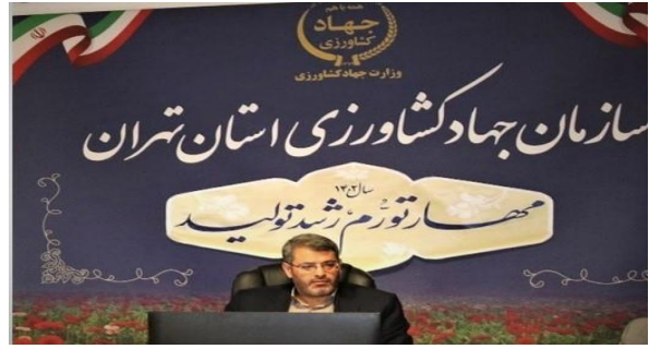
تامین ۱۵۰۰ تنی بازار مرغ استان تهران در آستانه شب یلدا/سهولت دسترسی مردم و شکستن قیمت ها؛ اولویت اصلی جهاد