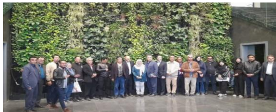
شهرستان پیشوا، میزبان وزیر کشاورزی و امنیت غذایی کشور مالزی / حضور وزیر کشاورزی مالزی در بزرگترین مجتمع تولید شیر خشک خاورمیانه در پیشوا