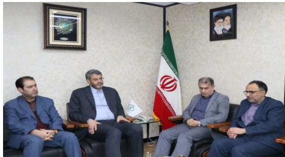
هم اندیشی مدیرعامل شرکت مادر تخصصی صندوق حمایت از توسعه سرمایه گذاری در بخش کشاورزی و رئیس سازمان جهاد کشاورزی استان برای توسعه بخش کشاورزی