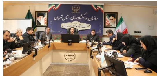
اراضی مستعد تأسیس واحدهای بزرگ مقیاس پرورش مرغ گوشتی در استان تهران شناسایی می شوند