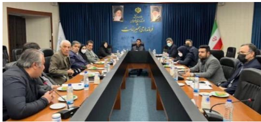
بررسی مسائل و مشکلات واحدهای کشاورزی، تخصیص انشعابات و کاهش تعرفه واحدهای دامداری و گلخانه در کارگروه کشاورزی شمیرانات