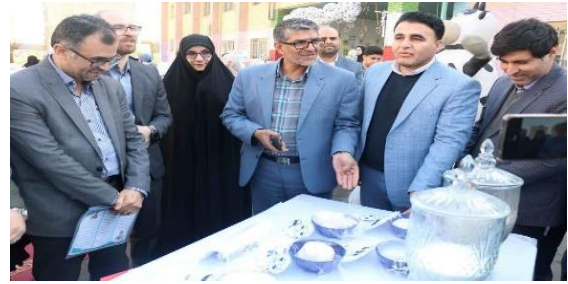
آغاز توزیع شیر رایگان مدارس شهرستان های استان تهران