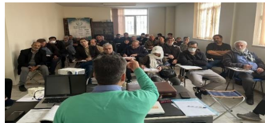
آموزش راههای پیشگیری و درمان سندروم لارومیبری به زنبورداران