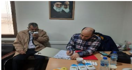
برای اولین بار، جلسه کمیسیون ماده ۸۷ (احراز درصد جانبازی) در جهاد کشاورزی استان تهران تشکیل و پرونده پزشکی ۱۰۰ تن از جهادگران استان تهران تعیین تکلیف شد